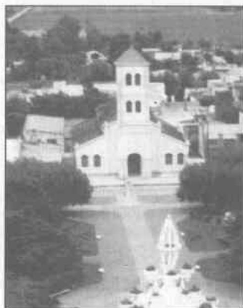
Laprida, un milagro tan cerca Leonardo Ibáñez .....